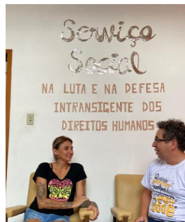
Figura 3: Atividade Atendimento de usuário realizado em 28/01/2025.

OBJETIVO ESPECÍFICO: de qualificar a oferta do serviço por meio da promoção da capacitação