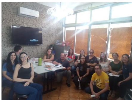
Figura 1: Atividade reunião junto a Gestão de Parcerias da SMAS ocorrida em 29/01/2025.