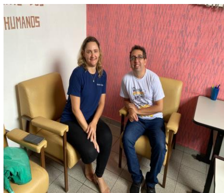
Figura 2: Atividade Diálogo e atendimento de familiar sobre encaminhamentos da Casa Betânia a Guarda Mirim, em 30/01/2025