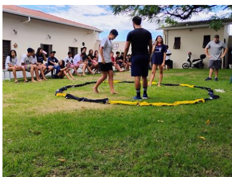
Figura 1: Atividade Oficina de Expressão corporal, ocorrida em 16/01/2025.