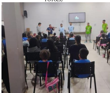
Figura 2: Atividade Oficina de Educomunicação, brincadeira de criança e a convivência em casa, realizada em 31/01/2025.