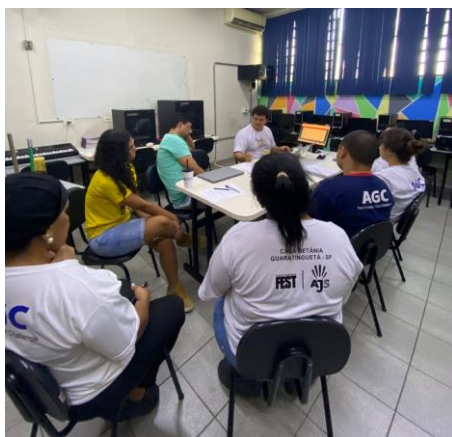
Figura 1: Reunião equipe técnica junto a educadores em 07/01/2025.