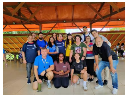
Figura 3: Equipe de parceria para a Colônia de férias EPAB com a presença de educadores da Secretaria de Esportes e colaboradores do projeto Franciscano Perfeita Alegria, além da Equipe da Casa Betânia. Realizada em 31/01/2025.

OBJETIVO ESPECÍFICO: De participação e Controle Social.